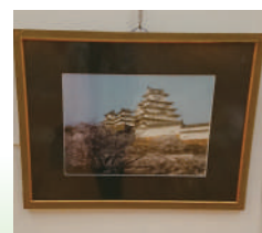
千頭和政彦さん作 「日本の美」