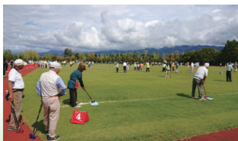
グラウンド・ゴルフ会場

令和5年9月23日、小瀬スポーツ公園（甲府市）にて、いきいき山梨ねんりんピックが開催されました。身延町からは「グラウンド・ゴルフ」、「ゲートボール」、「ラージボール卓球」に総勢30名が参加し、日頃の練習の成果を発揮しました。