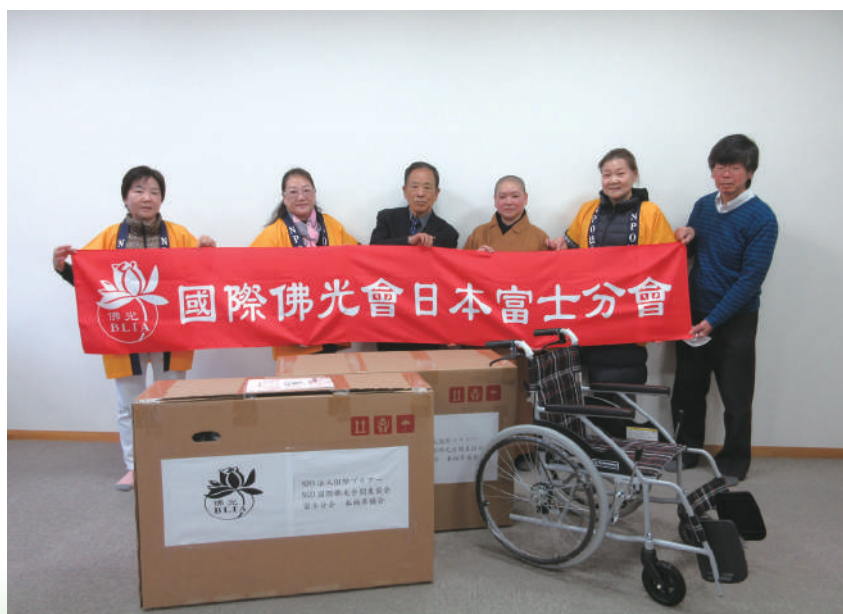
NPO 法人 国際ブリアー