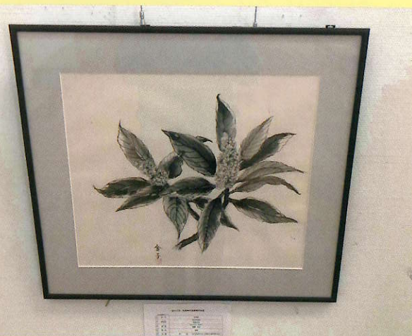
遠藤金子さん作「枇杷の花」