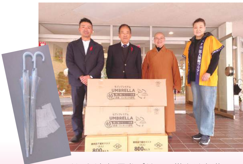
NPO法人 国際ブリアー様より寄贈