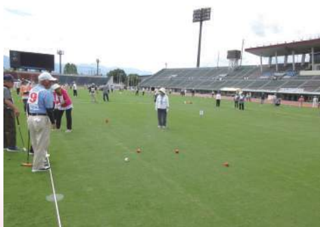
ゲートボール会場

令和6年9月21日、小瀬スポーツ公園（甲府市）にて、いきいき山梨ねんりんピックが開催され、身延町からは「グラウンド・ゴルフ」、「ゲートボール」、「ラージボール卓球」に参加し、日頃の練習の成果を発揮しました。