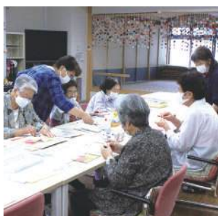
【中富・下部地区】 下部生きがい広場 身延町常葉1093番地 電話：0556-20-3023

介護予防は早く始めるほど効果があります。お友達を誘って、生きがい広場に遊びに来ませんか？