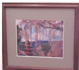
千頭和政彦さん作【写真の部門】